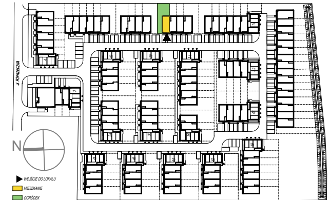
SCHEMAT PARTERU Z OGRÓDKAMI